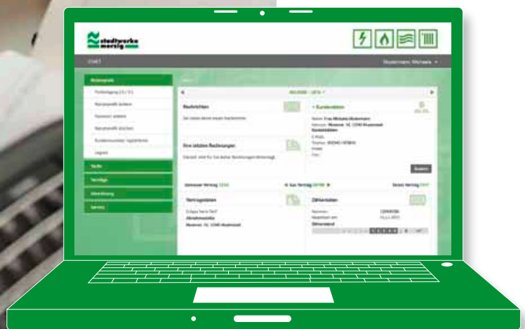
... oder einem Laptop oder Desktop-PC: Das neue Kundenportal der Stadtwerke Merzig ist auf allen Endgeräten komfortabel nutzbar sowie sieben Tage die Woche und 24 Stunden am Tag für Sie da