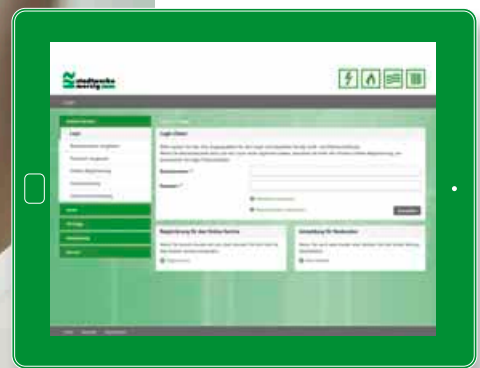
... mit einem Tablet ...